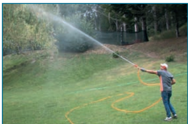
Pressione lancia regolabile - Regulating pressure lance