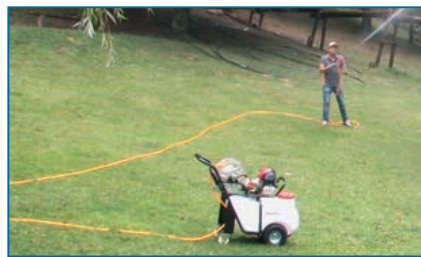
Tubo di 30 mt. - Hose 30 meters